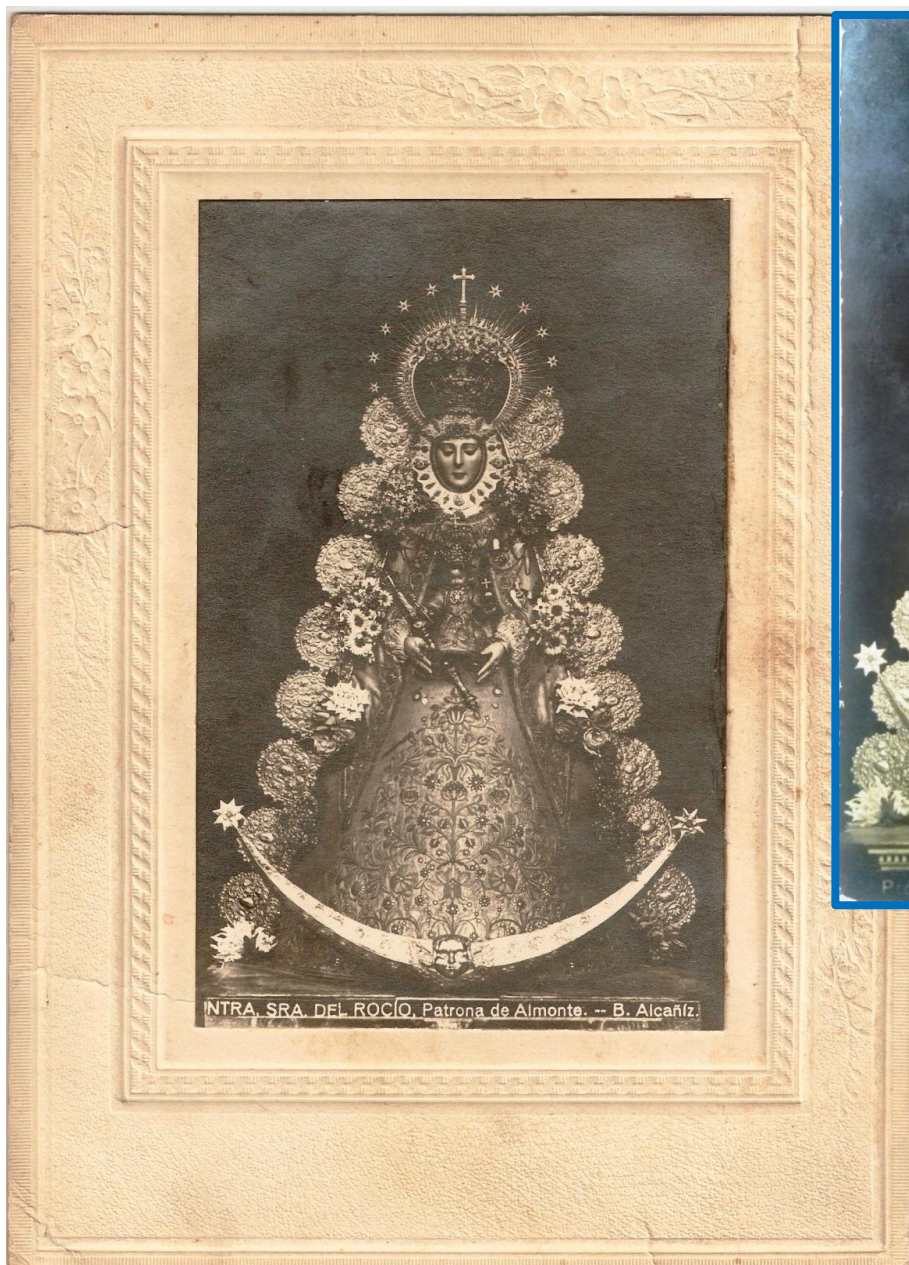
FOTO OFICIAL DE LA CORONACIÓN DE LA VIRGEN DEL ROCÍO EN 1919